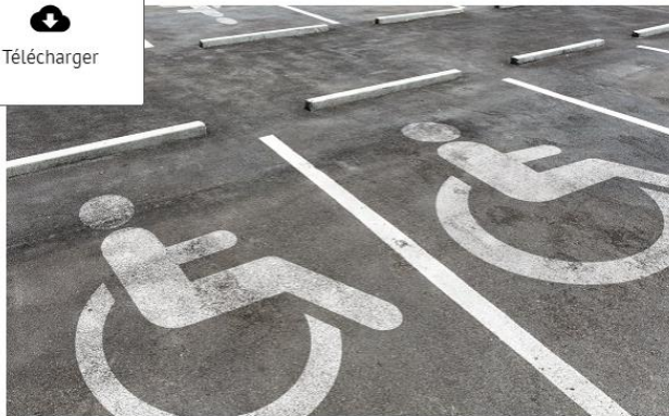
Le Conseil national consultatif des personnes handicapées souhaite que la Conférence nationale du handicap (CNH) "permette des échanges et ne soit pas uniquement une démarche descendante".