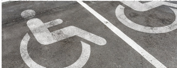
Le Conseil national consultatif des personnes handicapées souhaite que la Conférence nationale du handicap (CNH) "permette des échanges et ne soit pas uniquement une démarche descendante".

À l'approche de la Conférence nationale du handicap (CNH) du 26 avril, le Conseil national consultatif des personnes handicapées (CNCPH) rappelle que cet évènement « doit s'appuyer sur la participation des personnes concernées et favoriser la co-construction systématique des politiques publiques ».